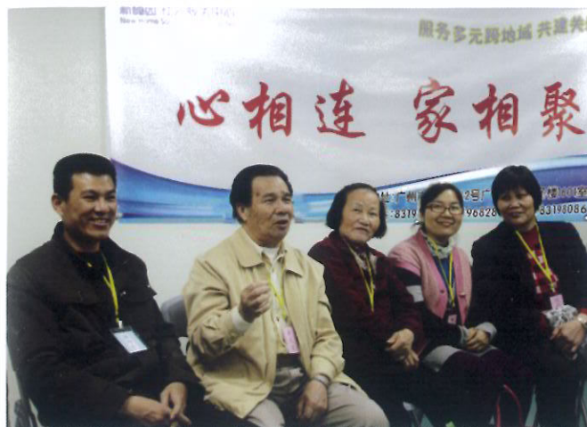
中心举办香港居民与其内地“超龄子女”团聚活动